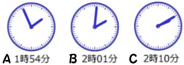
A 1時54分 B 2時01分 C 2時10分

A時計とC時計の時間の差は16分です。ずれているのは、3分・6分・10分なので、A時計とC時計が10分か6分ずれていて、B時計は3分ずれていると分かります。B時計の3分前→1時58分 3分後→2時4分 1時58分では、ほかの時計のずれと合わないで、答えは 2時4分 となります!