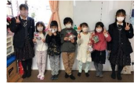
みんなよく頑張りました♪