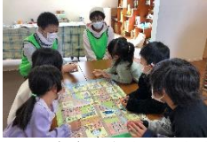
明石高専の学生さん考案 防災ボードゲーム