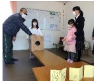
空気砲で敵を倒そう!

冬休みに開催したまなびイベント!東京オリピックも取材した神戸新聞社の記者さんから新聞記事の書き方を本格的に伝授してもらったり、空気砲やニュートンの実験をしたり、防災の秘訣を知ったりと、新発見やワクワクドキドキがたくさん5日間でした★