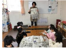
新聞記者から新聞の 書き方を教わりました!