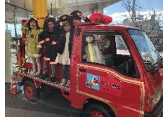
防災センターで防災体験!