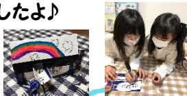
手作り船★ 家にある材料で、スクリュー がついた船ができました! 正確に長さを測り、細かく 作れましたね!