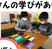
創作折り紙★ 自分で折り方を考えて お友達に教えてあげる姿 がとってもステキ!

やりたいことがあるとなんでも手作りしちゃうみつくすのみんな★11月は牛乳パック船や手作りゲーム、ビックリ仰天★不思議動画などたくさんの手作りが生み出されました♪作りながら、カッターや定規の使い方、わり算のヒント、iPadの新しい機能の発見など、たくさん学びがありましたよ!